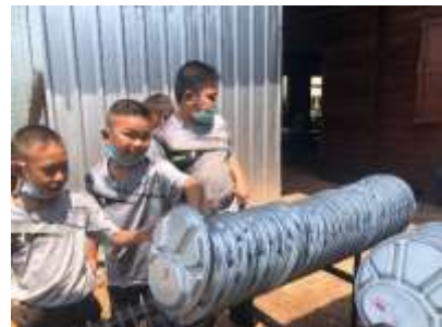
ภาพที่ 5 ล้างและจัดเก็บภาชนะสำหรับใส่อาหารของตนเอง