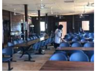
ภาพที่ 6 เวิร์ทำความสะอาดและปิดอาคารโรงอาหารรวมใจ