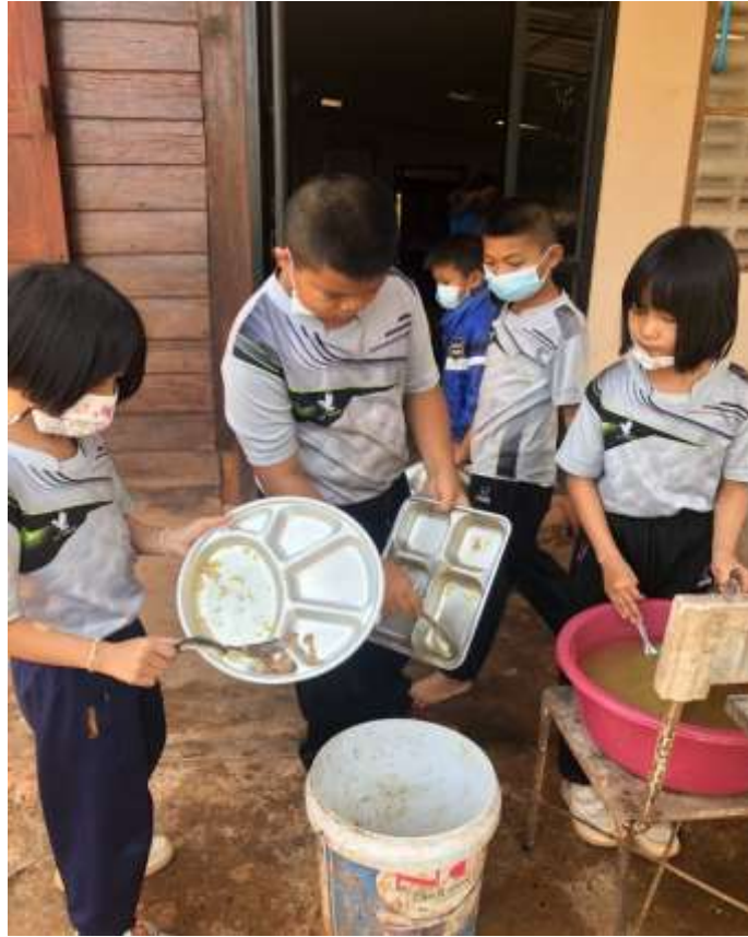
ภาพที่ 4 เศษอาหารนำไปเลี้ยงไก่เลี้ยงปลา