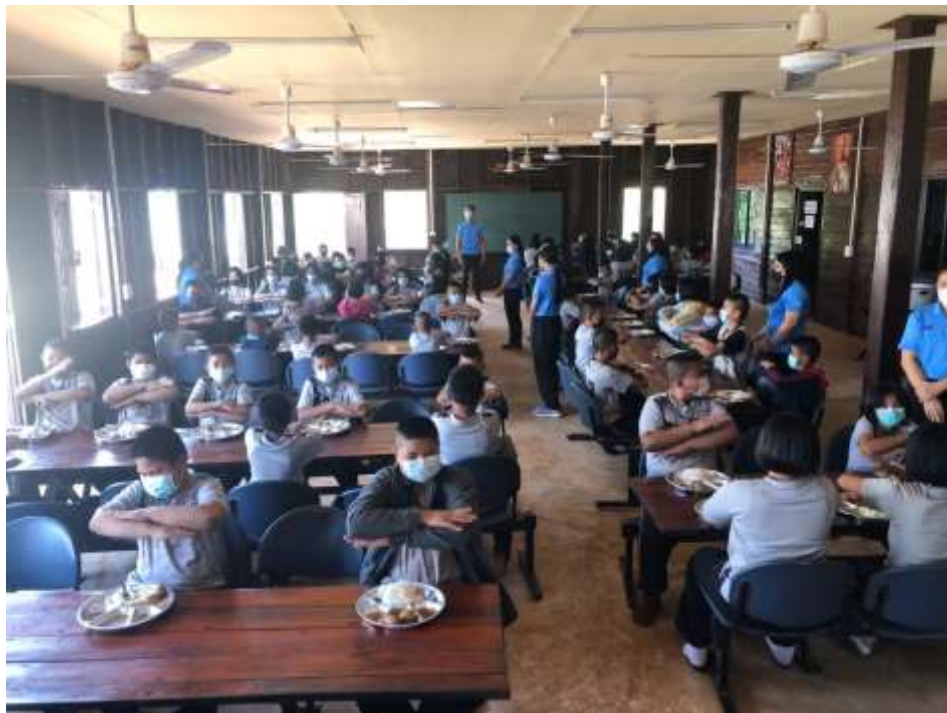
ภาพที่ 3 เตรียมพร้อมรับประทานอาหารกลางวัน