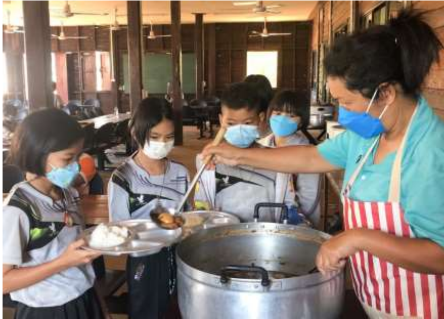
ภาพที่ 2 เข้าแถวรับอาหารจากแม่ครัวจิตอาสาของโรงเรียน