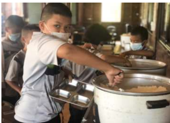
ภาพที่ 1 ตักพออิมเผื่อคนข้างหลัง

ในการดำเนินการโครงการอาหารกลางวัน ทางโรงเรียนเน้นให้นักเรียนทุกคนมีส่วนร่วม ในกิจกรรมต่าง ๆ เริ่มตั้งแต่การรู้จักหน้าที่ของตนเอง ชั้นเรียนใดที่มีหน้าที่เปิดโรงอาหารก็จะมาโรงเรียนแต่เช้า แบ่งเวรกันมาเปิดโรงอาหาร ทำความสะอาดเช็ดโต๊ะ เก้าอี้ให้พร้อมใช้ นักเรียนมัธยมก็จะมาช่วยแม่ครัว ประกอบอาหาร เมื่อถึงเวลารับประทานอาหารในเวลา 11.00 น. นักเรียนระดับชั้นอนุบาล 2 และ ระดับชั้น อนุบาล 3 จะมารับประทานอาหาร เวลา 11.30 น. นักเรียนชั้นประถมศึกษาปีที่ 1 – 3 จะมารับประทาน อาหาร และในเวลา 12.00 น. นักเรียนชั้นที่เหลือก็จะมารับประทานอาหาร ซึ่งในการ รับประทาน อาหาร การนั่งโต๊ะรับประทานอาหารนักเรียนทุกคนจะได้รับการปลูกฝังเรื่องการรู้จักพอประมาณ ตักข้าวให้ พอสำหรับตนเอง เมื่อคนที่มาทีหลัง การนั่งโต๊ะเก้าอี้ต้องรู้จักรักษาความสะอาด มีมารยาทในการ รับประทานอาหาร นักเรียนทุกคนมีถาดอาหาร ช้อน ส้อม และขวดน้ำดื่มเป็นของตนเองไม่ใช่ปะปนกับคนอื่น รับประทานอาหารที่ตนเองตักมาให้หมด เมื่อรับประทานอาหารเสร็จก็ล้าง ทำความสะอาดด้วย ตนเอง จัดเก็บให้เป็นระเบียบ ปลอดภัยจากสัตว์ที่เป็นพาหะนำโรคต่าง ๆ เมื่อทุกคนรับประทานอาหารเสร็จ นักเรียนที่เป็นเวรรักษาความสะอาดจะช่วยกันทำความสะอาด ปิดไฟ ปิดพัดลม ปิดประตูหน้าต่างให้เรียบร้อย