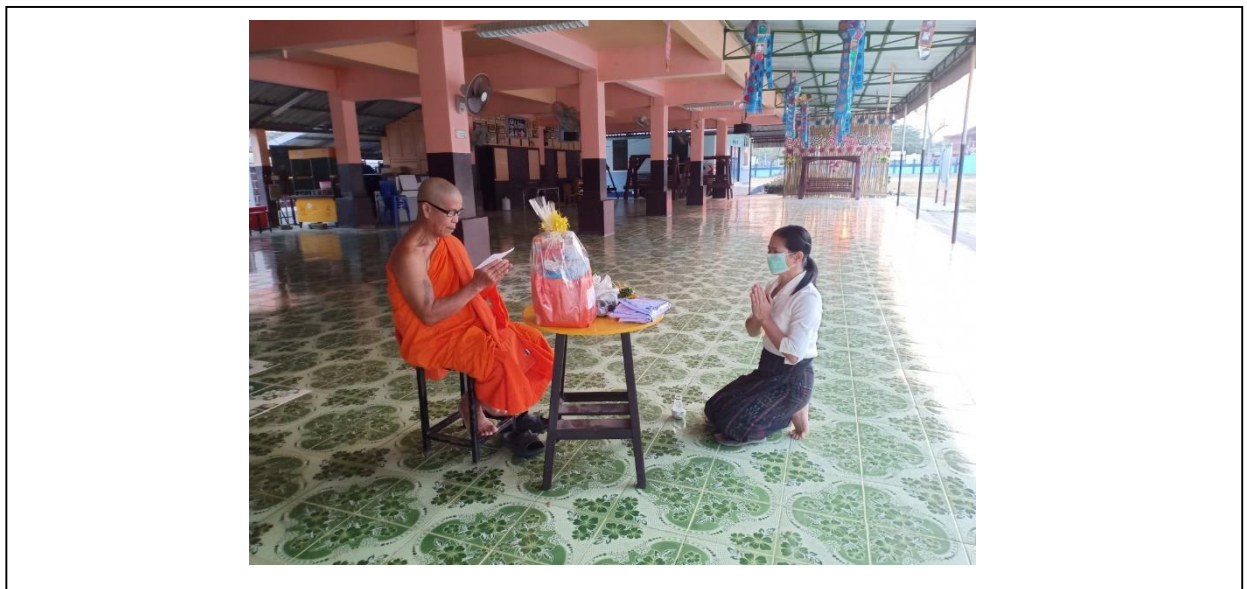
การทำบุญตักบาตรพระสงฆ์ และการถวายสังฆทานพระสงฆ์