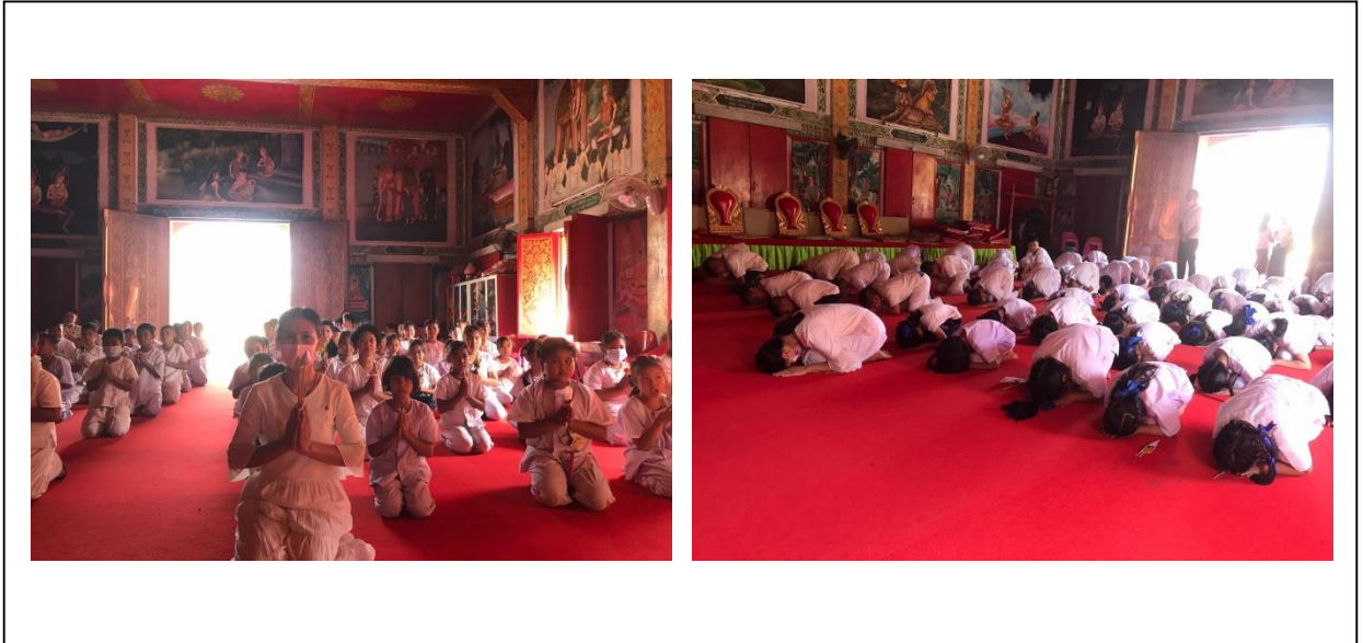
พิธีเจริญพระพุทธมนต์ เจริญจิตตภาวนาถวายพระพรชัยมงคล