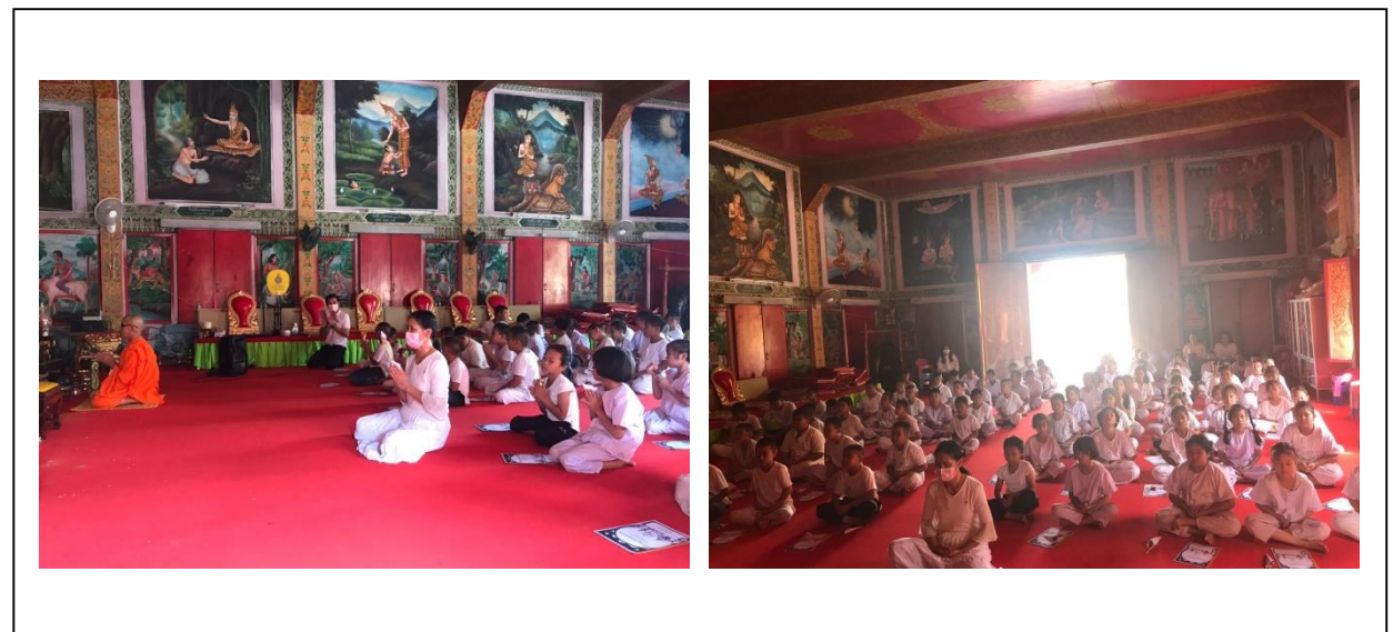
การปฏิบัติธรรมของพระสงฆ์ และคฤหัสถ์