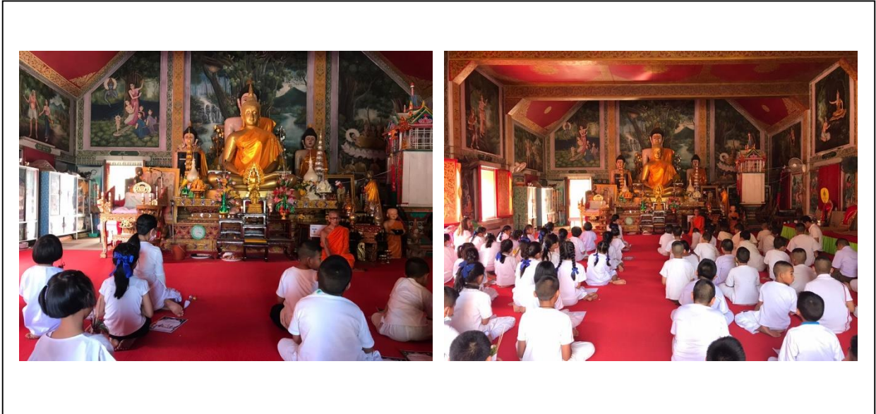
การแสดงพระธรรมเทศนา การบรรยายธรรม และการสนทนาธรรม